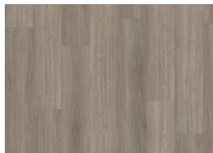
Whinfell - Click 6 mm