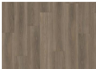
Tiveden - Click 6 mm