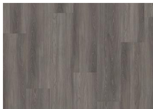
Wentwood - Click 6 mm