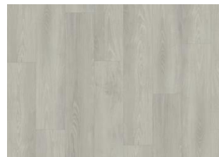
Yukon - Click 6 mm