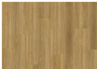
Fontin - Click 6 mm