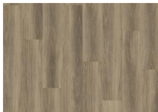
Hanmer - Click 6 mm