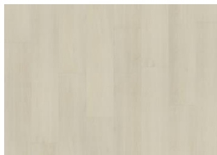
Aspen - Click 6 mm