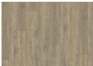
Taiga - Click 6 mm