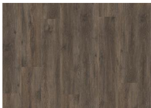
Saxon - Click 6 mm