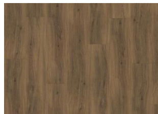
Redwood - Click 6 mm