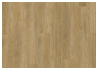
Sapo - Click 6 mm