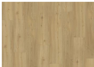
Oulanka - Click 6 mm