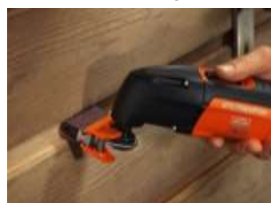
Profil pusse sett