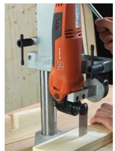
Holdeinnretning for bord