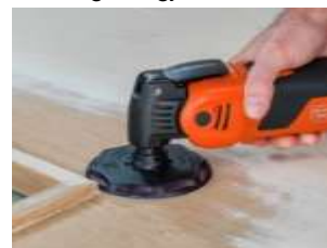
Slipeplate Ø 115 mm