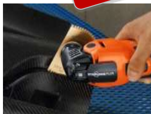
GFRP / CFRP sagblad