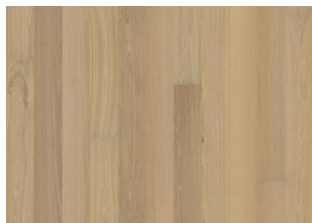
Eik Honey Oat